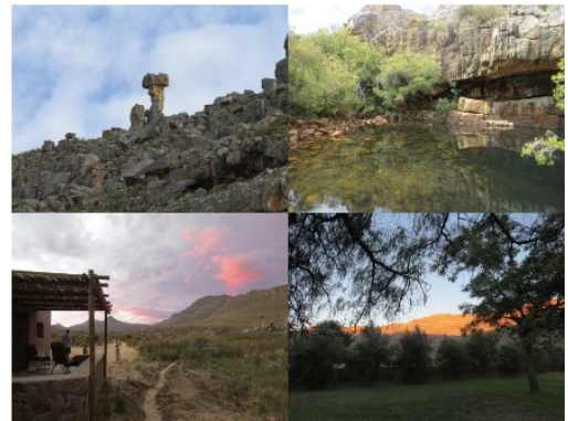
Kromrivier Lodge und Umgebung

Die Kromrivier Farm wie auch ihre Umgebung sind landschaftlich so reizvoll, dass es sich unbedingt lohnt, diesen Tag hier zu verbringen. Egal ob man früh morgens mit auf anspruchsvolle aber schöne Wanderung zum Disa's Rockpool geht (ca. 4 Stunden) oder einfach diese großartige Landschaft von der Terrasse der modernen Cottages aus auf sich wirken lassen möchte, der Intensität dieser Umgebung kann man sich nur schwer entziehen. Übrigens, man kann hier auch Pferde ausleihen und mit einer erfahrenen Führung vom Sattel aus dieses schöne Hochtal erkunden.