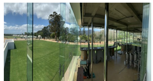
Weingut unter Glas – Constantia Uitsig

Am Nachmittag brechen wir von hier direkt zum Flughafen auf.