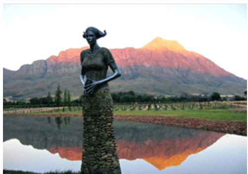
A piece of art at Saronsberg

Vormittags durchqueren wir die Cederberge Richtung Süden. Die Schotter- und Sandpiste zieht sich durch die bizarre, einsame Landschaft dieser Berge, bevor sie die üppig grüne Region der Obstplantagen vor Ceres erreicht. Gegen Mittag kommen wir schließlich im Tulbagh Tal an. Tulbagh ist von bis zu 1.700m hohen Bergen umgeben und bietet dem Weinbau ein ganz besonderes Klima. Hier beziehen wir unsere schön gelegene Unterkunft am Weingut Saronsberg (1 Nacht).