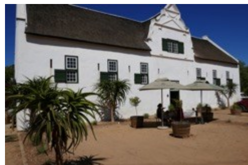
bei Groot Post

Hier erwartet uns unser erster Gamedrive, also eine Safari Fahrt – am Weingut! Erst danach verkosten wir die vielen spannenden Weine. Darunter sind der besonders beliebte und mineralische Seasalter, der Pinch of Chardonnay, spannende Rotweine und zwei am Weingut handgerüttelte MCC Brut (=methode cape classique Schaumweine). Nach der Weinprobe lockt ein leckeres Mittagessen im historischen Farmhouse Hilda's Kitchen.