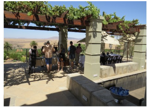
Terrasse bei Org de Rac

Nach dem Frühstück nehmen wir Abschied von der Westküste und brechen auf Richtung Norden. Bei Piketberg und unweit der N7 Richtung Namibia liegt das Bio-Weingut Org de Rac . Obwohl das Meer ca. 50km entfernt ist, erreichen regelmäßig kühlende Brisen die Weinberge. Das Weingut ist spezialisiert auf Merlot und Chardonnay, erzeugt aber auch kräftige Shiraz, Cabernet Sauvignon und die für Südafrika seltenen Rebsorten Roussanne und Verdelho. Nach einer Weinbergstour und Verkostung erwartet uns ein leichtes Mittagessen.