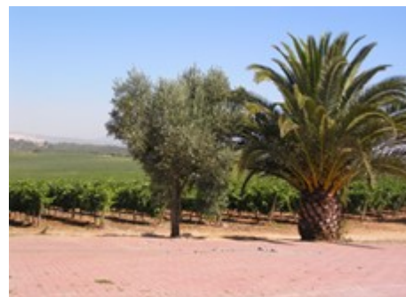
Palme, Olive, Weinberg – die Quinta do Carneiro