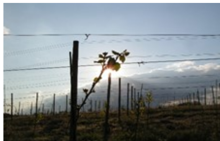
Weinberge im Dao