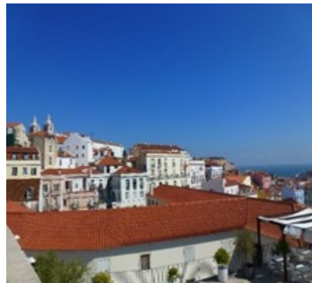
Im Beiro Alto in Lissabon