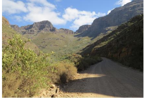
Dirtroad in den Cederbergen