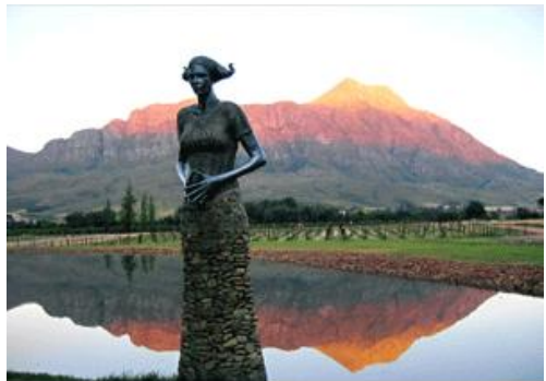
A piece of art at Saronsberg