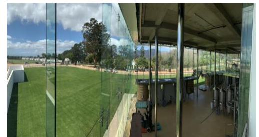
Weingut unter Glas – Constantia Uitsig

Am Nachmittag brechen wir von hier direkt zum Flughafen auf.