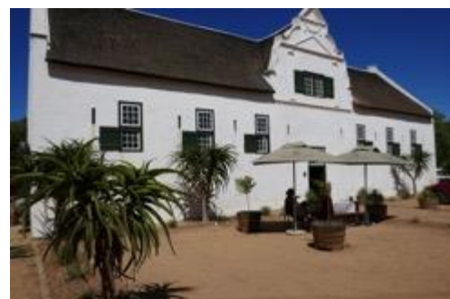
bei Groot Post

Hier erwartet uns unser erster Gamedrive, also eine Safari Fahrt – am Weingut! Erst danach verkosten wir die vielen spannenden Weine. Darunter sind der besonders mineralische und langlebige Unwooded Chardonnay, ein spannender sortenreiner Semillon und natürlich der handgerüttelte Brut Rosé Sekt. Nach der Weinprobe lockt ein leckeres Mittagessen im historischen Farmhouse Hilda's Kitchen.