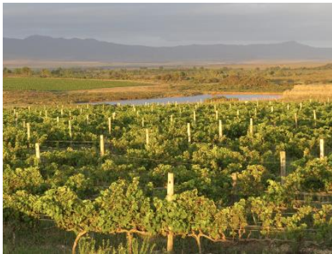
Weinberge am Ende des Kontinents – Strandveld!

Nach dem Frühstück machen wir uns auf an die Südspitze Afrikas. Wir durchqueren die Overberg Region, die Kornkammer des Western Cape. Entlang an den abgemähten Weizenfeldern gelangen wir schließlich in den Distrikt Agulhas an Südspitze des Kontinents. Die Gegend mit ihrer Seenlandschaft und dem Schilfgras erinnert etwas an die Nordseeküste. Hier befindet sich das größte Süßwassersystem des südlichen Afrikas, die sogenannten Vleis. Mit etwas Glück haben wir sogar die Gelegenheit, die hier wieder angesiedelten Nilpferde zu sehen. Bei dem historischen Örtchen Elim erreichen wir unsere Unterkunft Doornbosch Guest Lodge (2 Nächte). Hier hat ein engagierter Investor Ende der Neunziger Jahre ca. 5000 Hektar der besonderen regionalen Fynbos Flora aufgekauft, um sein eigenes Nature Reserve zu etablieren und dieses mit Naturliebhabern zu teilen. Die Anlage sowie die Häuser sind recht großzügig gestaltet, der Blick geht weit. Hier finden sich keine Big