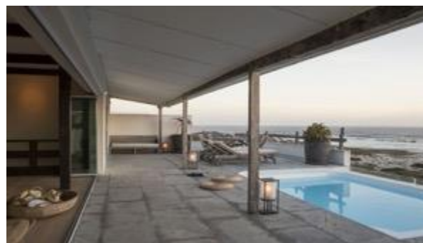
Strandlage im Küstenstädtchen Yzerfontein