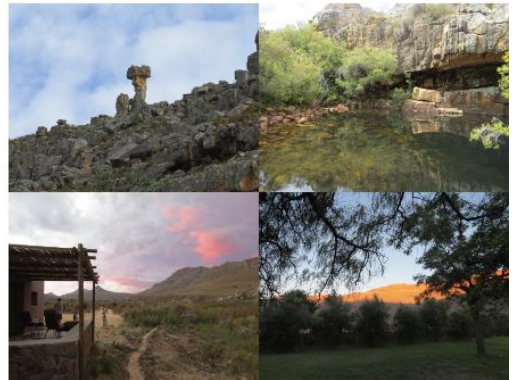
Kromrivier Lodge und Umgebung