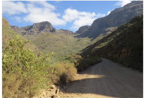
Dirtroad in den Cederbergen