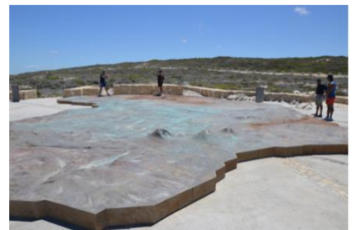
Auf der großen Metallplatte des afrikanischen Kontinents am Kap Agulhas

Nur wenige Kilometer trennen uns vom Weingut Strandveld in der Agulhas Weinregion, dem südlichsten Weingut Afrikas! Man erwartet uns hier am späteren Nachmittag zur Verkostung exquisiter, vom Atlantik stark beeinflusster Weine. Der salzige Wind vom Atlantik weht hier oft so stark, dass er die Erntemenge ohne manuelles Zutun stark begrenzt. Die Reben müssen hart im Nehmen sein, die Trauben reifen später und ergeben tiefgründige und besonders vom Terroir geprägte, recht mineralische Weine. In diesem sehr gemäßigten Klima gelingen auch außerordentlich schöne und recht langlebige Pinot Noirs. Nach einem Besuch der Weinberge und einer ausführlichen Verkostung lockt ein herzhaftes Abendessen am gemütlichen Feuer.