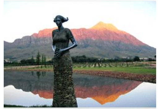
a piece of art at Saronsberg