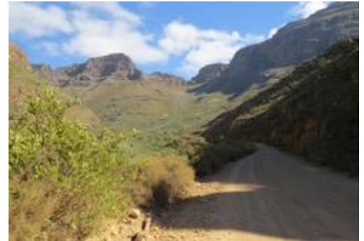
Dirtroad in den Cederbergen

Weiter geht es auf der N7. Etwas nördlich von Citrusdal zweigen wir ab auf eine landschaftlich sehr reizvolle Dirtroad Strecke (Schotterpiste), die uns in die mächtig daliegenden Cederberge führt, den höchsten Bergen am Western Cape. Die Schotterpiste schlängelt sich an Berghängen hoch bis auf ca. 1.100m Höhe. Inmitten der Ruhe und Weite der Cederberge finden wir ganz einsam gelegen die Kromrivier Farm (2 Nächte). Die Besitzer der Kromrivier Farm waren in den letzten Jahren sehr kreativ tätig: so haben sie eine eigene kleine Micro-Brewery aufgebaut, erzeugen auf 3ha Rebfläche sogar eigene Weine und bieten leckeres Essen im farneigenen Restaurant.