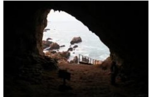
Ursprungsort des Homo Sapiens?