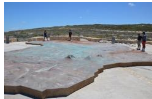
Auf der großen Metallplatte des afrikanischen Kontinents am Kap Agulhas

Angekommen am Cape l'Agulhas, der Südspitze Afrikas bietet der Punkt, an dem Indischer Ozean und Atlantik zusammentreffen ein sehr beliebtes Fotomotiv.