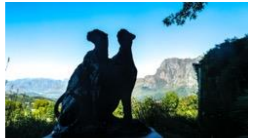
Skulpturen bei Delaire-Graff

Am Nachmittag brechen wir von hier direkt zum Flughafen auf.