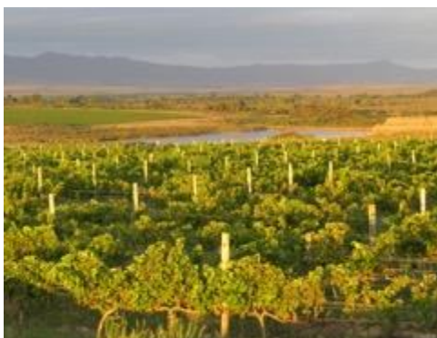
Weinberge am Ende des Kontinents – Strandveld!

Am Nachmittag erreichen wir unsere Unterkunft Doornbosch Guest Lodge beim historischen Ort Elim (1 Nacht). Hier hat ein engagierter Investor Ende der Neunziger Jahre ca. 5000 Hektar der besonderen regionalen Fynbos Flora an der Südspitze Südafrikas aufgekauft, um sein eigenes Nature Reserve zu etablieren und dieses mit Naturliebhabern zu teilen. Die Anlage sowie die Häuser sind recht großzügig, der Blick geht weit. Hier finden sich keine Big Five , aber die regionalen Farmer haben sich zusammengeschlossen, um auch den Tiny Ten eine besondere Aufmerksamkeit zu verleihen.