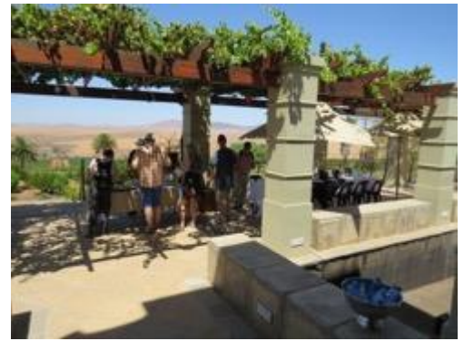
Terrasse bei Org de Rac

Nach dem Frühstück nehmen wir Abschied von der Westküste und brechen auf in Richtung Piketberg. Hier, unweit der N7 Richtung Namibia, liegt das Bio-Weingut Org de Rac . Obwohl der Atlantik nicht in Sichtweite ist, erreichen regelmäßig kühlende Brisen die hoch gelegenen Weinberge. Das Weingut ist spezialisiert auf Merlot und Chardonnay, erzeugt aber auch kräftige Shiraz, Cabernet Sauvignon und die für Südafrika eher seltenen Rebsorten Roussanne und Verdelho. Nach einer Weinbergstour und Verkostung erwartet uns ein leichtes Mittagessen.