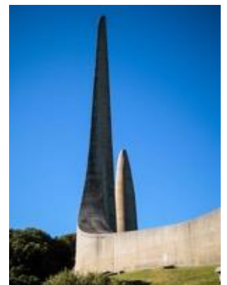
Language Monument bei Paarl