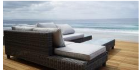
Chill Out am Indischen Ozean

Jetzt trennt uns nur noch ein kurzes Stück zu unserer Unterkunft in Mossel Bay (2 Nächte). Hier können wir Strand und Sommer am Indischen Ozean genießen.