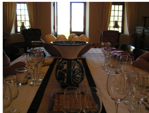
Grootte Post Dining Room

Nachmittags und Abends entspannen wir wieder in unserer Unterkunft am Atlantik.