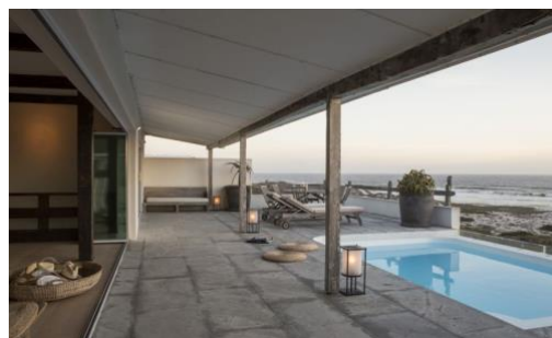
Strandlage im Küstenstädtchen Yzerfontein