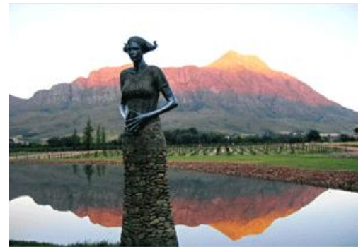
a piece of art at Saronsberg