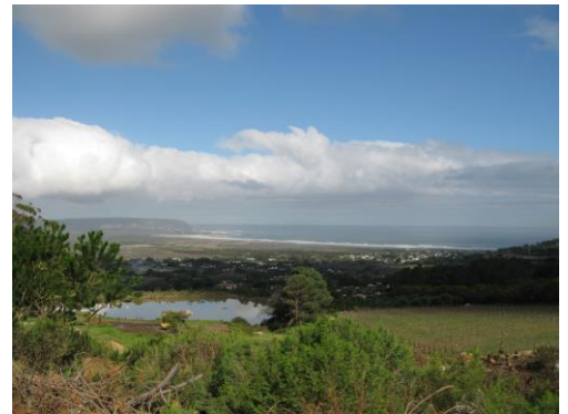
Blick von Cape Point Vineyards

Ein langer Tag voller Eindrücke erwartet uns. Am frühen Vormittag fahren wir zum Cape Point National Park mit dem Leuchtturm steil auf den Felsen am Cape Of Good Hope. Mittags finden wir uns beim Weingut Cape Point Vineyards zur Weinprobe und zu einem leichten Lunch ein. Es handelt sich hier um eines der 'maritimsten' wie auch gleichzeitig um das südwestlichste Weingut Afrikas: die Weinberge schmiegen sich idyllisch an die Hänge des Chapman's Peak mit tollem Blick auf den nahen Atlantik, haben die False Bay aber in nur 15km Entfernung im Rücken.