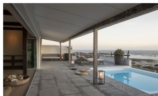
Strandlage im Küstenstädtchen Yzerfontein