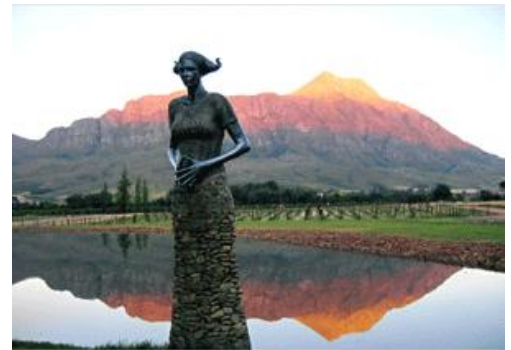
a piece of art at Saronsberg