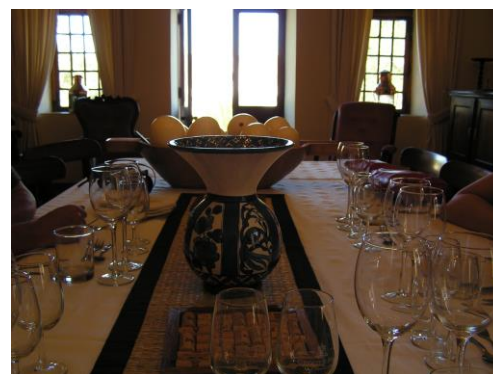
Groot Post Dining Room

Nachmittags und Abends entspannen wir wieder in unserer Unterkunft am Atlantik.