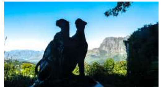
Skulpturen bei Delaire-Graff

Am Nachmittag brechen wir von hier direkt zum Flughafen auf.