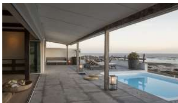
Direkte Strandlage im Küstenstädtchen Yzerfontein