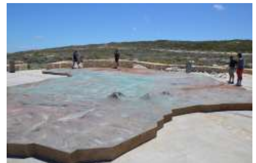
Auf der großen Metallplatte des afrikanischen Kontinents am Kap Agulhas

Nur wenige Kilometer trennen uns vom Weingut Strandveld in der Elim Weinregion, dem südlichsten Weingut Afrikas! Man erwartet uns hier am späteren Nachmittag zur Verkostung exquisiter, vom Atlantik stark beeinflusster Weine. Der salzige Wind vom Atlantik weht hier oft so stark, dass er die Erntemenge ohne manuelles Zutun stark begrenzt. Die Reben müssen hart im Nehmen sein, die Trauben reifen später und ergeben tiefgründige und besonders vom Terroir geprägte, recht mineralische Weine. In diesem sehr gemäßigten Klima gelingen auch außerordentlich schöne und recht langlebige Pinot Noirs. Nach einem Besuch der Weinberge und einer ausführlichen Verkostung lockt ein herzhaftes Abendessen am gemütlichen Feuer.