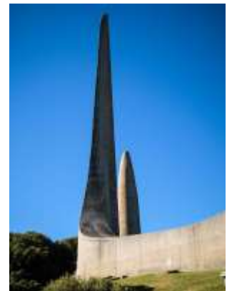
Language Monument bei Paarl