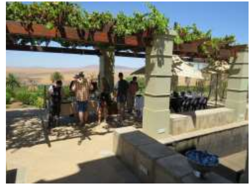
Terrasse bei Org de Rac

Nach dem Frühstück nehmen wir Abschied von der Westküste und brechen auf gen Norden nach Piketberg. Hier in der Nähe von Piketberg und unweit der N7 Richtung Namibia liegt das Bio-Weingut Org de Rac. Obwohl das Meer nicht mehr in Sichtweite ist, erreichen regelmäßig kühlende Brisen die Weinberge. Das Weingut ist spezialisiert auf Merlot und Chardonnay, erzeugt aber auch kräftige Shiraz, Cabernet Sauvignon und die für Südafrika seltenen Rebsorten Roussanne und Verdelho. Nach einer Weinbergstour und Verkostung erwartet uns ein leichtes Mittagessen.