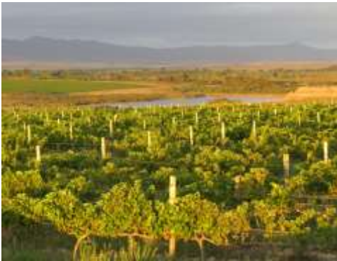
Weinberge am Ende des Kontinents – Strandveld!

Aus dem Robertson Tal geht es weiter Richtung der Südspitze Afrikas. Die Overberg Region am Ende des Kontinents erinnert etwas an die Nordseeküste. Hier befindet sich auch das größte Süßwassersystem des südlichen Afrikas, die Vleis. Mit etwas Glück haben wir sogar die Gelegenheit, die hier wieder angesiedelten Nilpferde zu erleben.