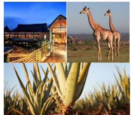
Garden Route Game Lodge, Big Five, Aloe Ferox

Wir brechen früh auf zu unserer längsten Strecke. Nach der Durchquerung der einsamen Cederberge gen Süden gelangen wir schließlich auf die N1, von der wir bei Laingsburg abbiegen, um zum Seweweeks Poort Pass zu gelangen. Diese ca. 18km lange Passstrecke gilt als eine der schönsten Südafrika. Von hier sind es noch ca. 2h bis zum Ziel, der Garden Route Game Lodge , wo wir heute übernachten werden. In der Provinz Western Cape können wir nicht dieselben wild life Bedingungen erwarten wie im Krüger Park im Norden. Dafür haben wir eine gute Chance, den BIG FIVE tatsächlich zu begegnen und auch einiges über die Flora zu erfahren. Mit einigem Glück werden wir bei unserem abendlichen Safari Drive oder beim zweiten Safari Drive am frühen nächsten Morgen viele dieser mächtigen Tiere beobachten können. Ansonsten lädt die schön gestaltete Anlage mit ihrem Pool zum Entspannen ein (1 Nacht).