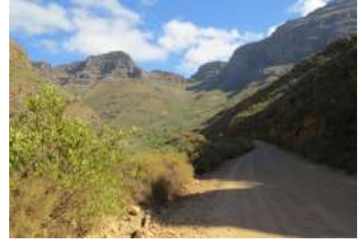
Dirtroad in den Cederbergen

Weiter geht es auf der N7. Etwas nördlich von Citrusdal zweigen wir auf eine landschaftlich sehr reizvolle Dirtroad Strecke (Schotterpiste) ab, in die mächtig daliegenden Cederberge, den höchsten Bergen am Western Cape. Die Schotterpiste schlängelt sich an Berghängen hoch bis auf ca. 1.100m Höhe. Inmitten der Ruhe und Weite der Cederberge finden wir ganz einsam gelegen die Kromrivier Farm (2 Nächte). Die Besitzer der Kromrivier Farm waren in den letzten Jahren sehr kreativ tätig: so haben sie eine eigene kleine Micro-Brewery aufgebaut, erzeugen auf 3ha Rebfläche sogar eigene Weine und bieten leckeres Essen im farmeigenen kleinen Restaurant. Vor dem Abendessen verkosten wir noch die ersten Kromrivier-Weine.