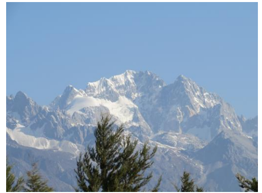
Jade Dragon Snow Mountain