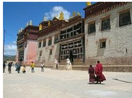
Tempel bei Shangri-La