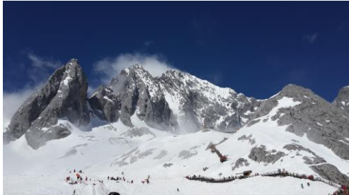
Jade Dragon Snow Mountain