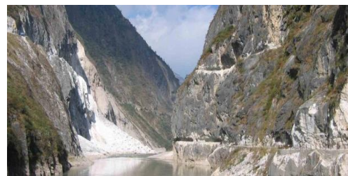
In der Tigersprung-Schlucht